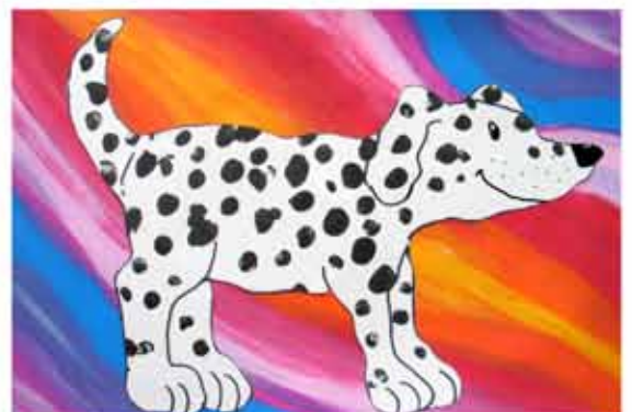
9. Hund 3a