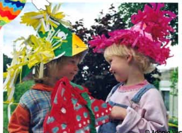
9. Lustige Hüte