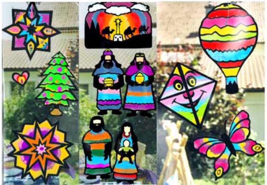
19. Transparente Fensterbilder