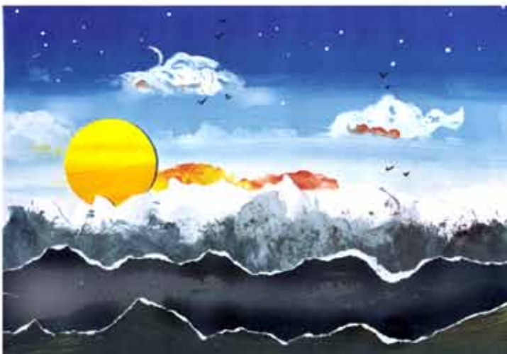
16. Sonnenuntergang mit Schneebergen