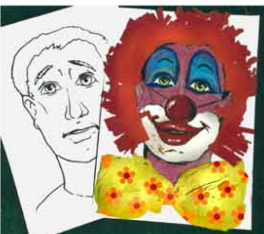
4. Clowngesicht schminken