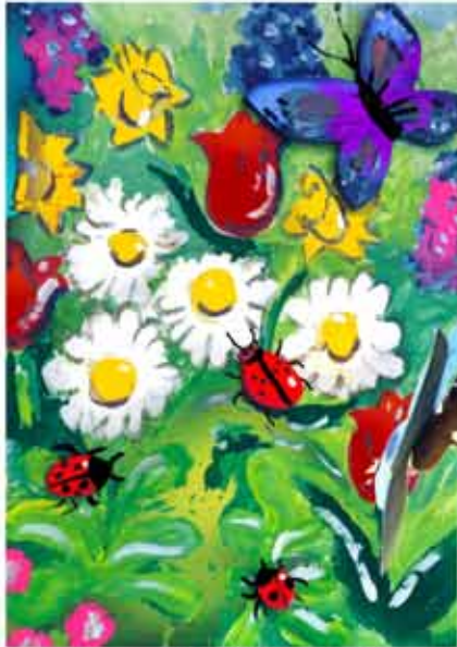
6. Grosses Frühlingsbild