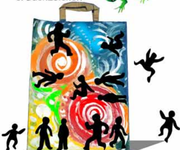
4. Fröhliche Einkaufstasche