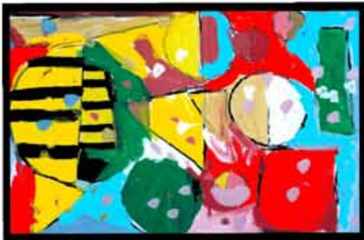
13. Malen wie Wassily Kandinsky