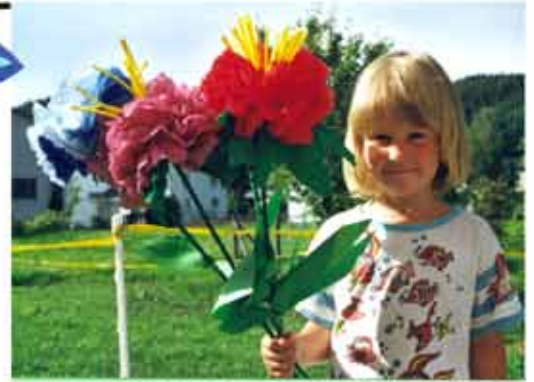
7. Grosse Papierservietten- blumen