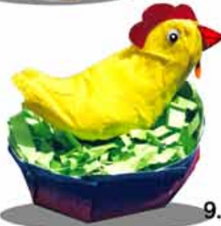
9. Huhn im Nest