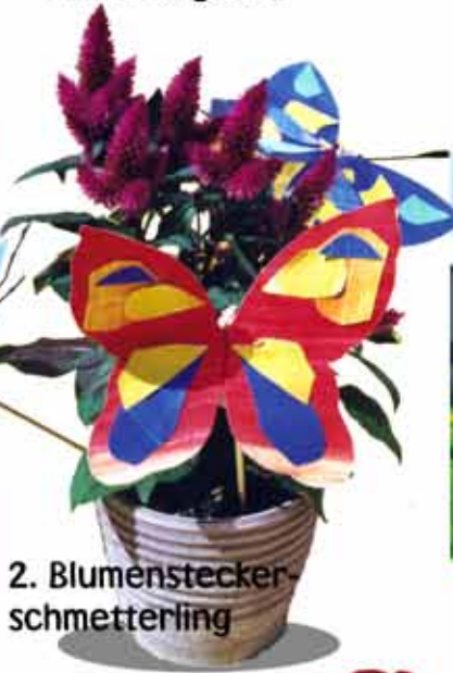
2. Blumenstecker- schmetterling