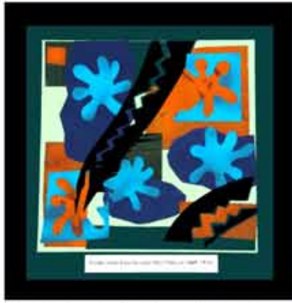
11. Malen wie Henri Matisse