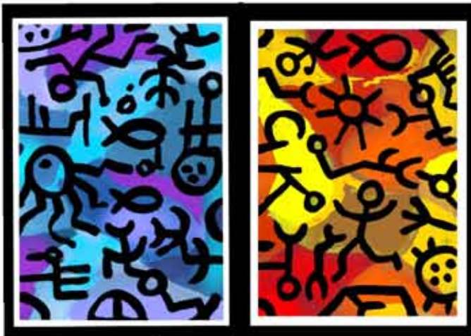
12. Malen wie Paul Klee